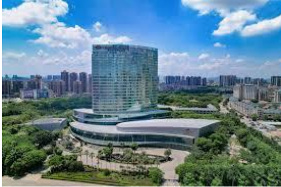
惠州皇冠假日酒店