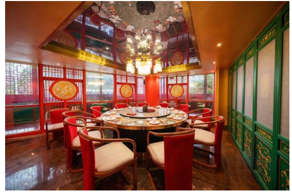
燈船·大唐不夜城海天盛宴